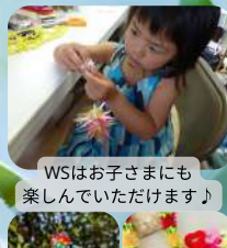
WSはお子さまにも 楽しんでいただけます♪