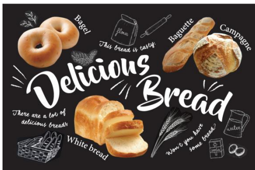
チョークアートイメージ(一例)