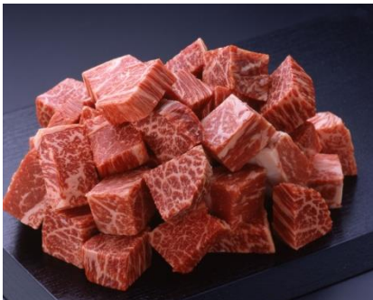
精肉 「柿安本店」 飛騨牛サイコロブロック

岐阜には飛騨牛、飛騨トマト、飛騨牛乳、天然鮎、各務原にんじん等、岐阜県には魅力あふれる食材が充実しております。各店舗では、特産品を始め、6次産業化の商品など、岐阜県の食文化の魅力を積極的にプロモーションする売場作りを目指します。またお惣菜メニューにも、岐阜県の食材を使用し、地場商品の展開に力を入れ、岐阜の食文化を発信する「食のセレクトショップ」を展開していきます。