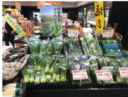
青果 「菜果善」 岐阜県産 旬の野菜