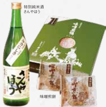
特別純米酒 さんやぼう