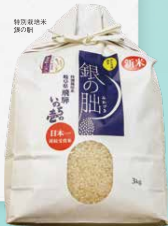
特別栽培米 銀の胆